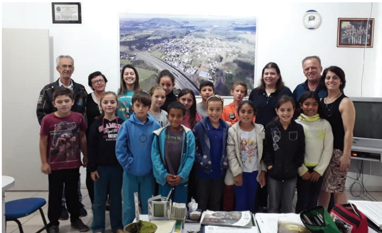
O Prefeito Municipal recebeu os alunos das turmas de 3° e 4° ano da Escola Margarida Ribeiro em seu gabinete.

Alunos da Escola Margarida Ribeiro visitam o prefeito de Tabai- Página 05