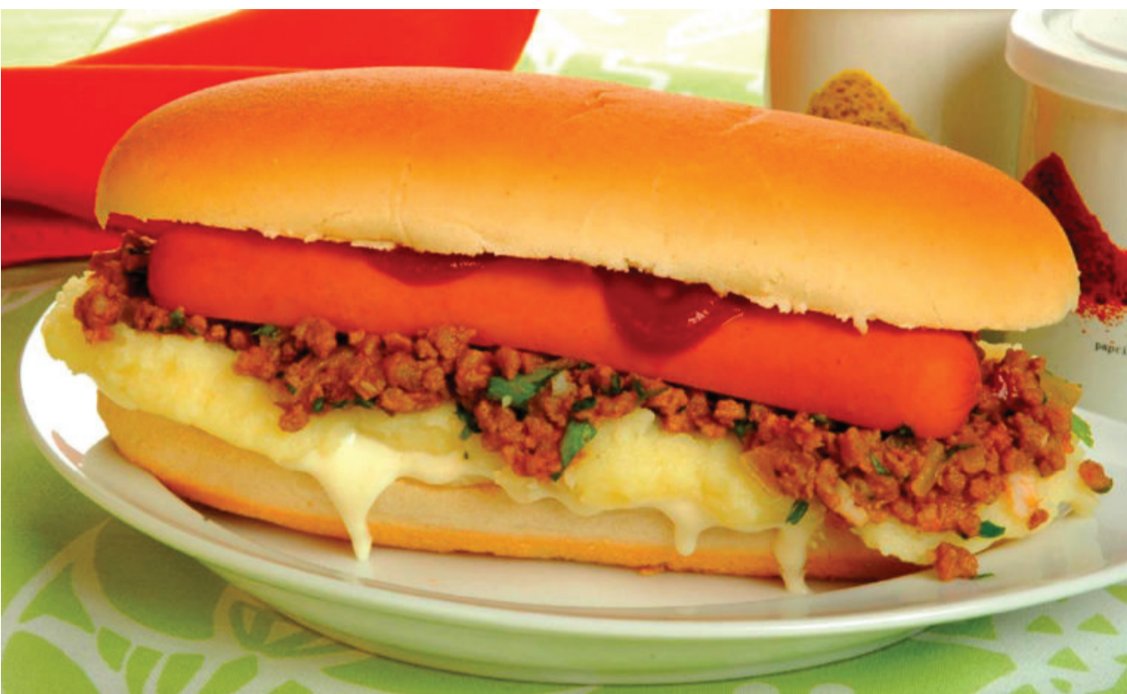
Foto: Marcelo Breyne/Colaborador | Produção: Denise Costa/Cecília Salomão

Cachorro-quente com carne moída e purê de batatas é uma receita clássica reinventada!