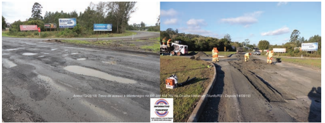
BR 386 KM 392 Coxilha Velha em Triunfo, no trevo de acesso à Montenegro/ Antes/Depois nas imagens