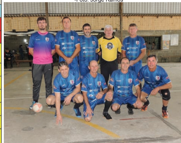
ACBF MASTER