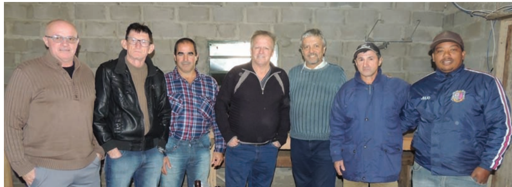
Ginásio Vasco Pinto de Azevedo na Vila Tabaí

O Ex-Prefeito de Montenegro, Paulo Azeredo prestigiou no dia (03), a abertura do 2º Campeonato Municipal de Futsal de Tabaí. Paulo Azeredo foi o 45º prefeito de Montenegro entre 2013/2015. Também foi Deputado Estadual e Vereador,