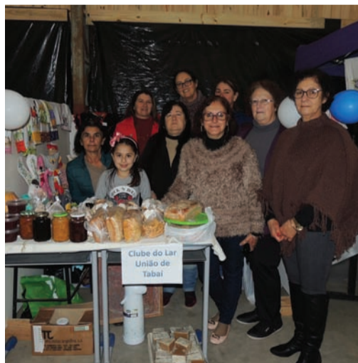
Expositores, entre agricultura familiar, artesanatos e ONG os Salvadores.