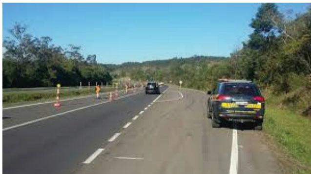
O local terá pista simples durante os próximos meses.

Desde está quarta-feira, dia 7, o tráfego de veículos sofre alterações na BR-386, em Paverama. De acordo com a CCR ViaSul, o trânsito no trecho entre os kms 373 e 375 está sendo desviado para as duas faixas do sentido interior – capital.