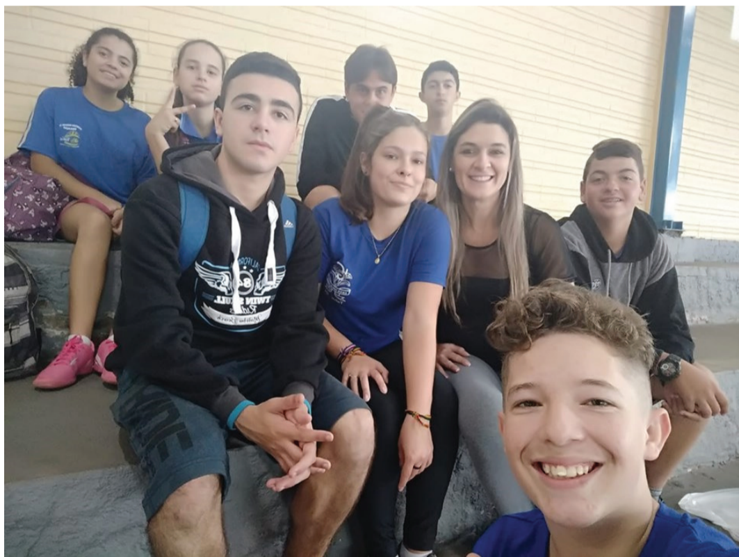
Alunos da rede municipal de Tabai/RS