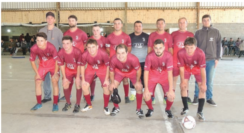
Equipe da Juventus