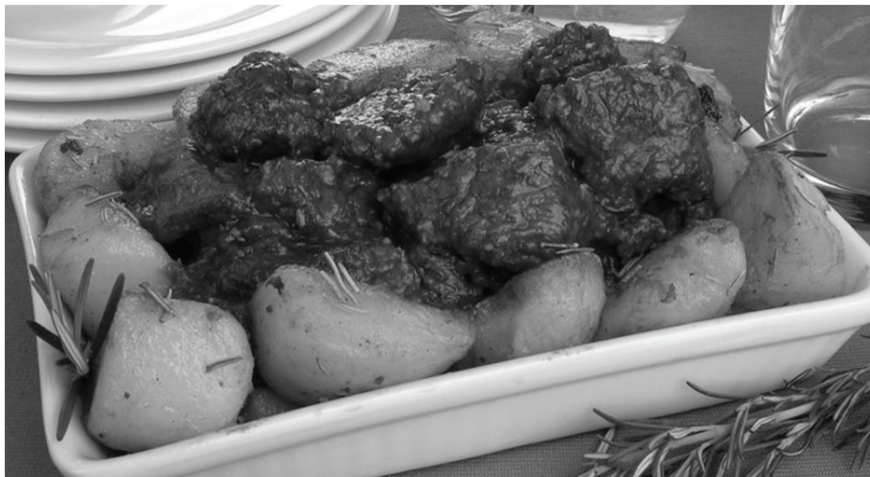
Produção: Stela Handa e Maria Olinda Cabral-Guia de Cozinha

Já está na hora de pensar no cardápio para o Dia dos Pais. Para homenagear aquela pessoa que esteve ao seu lado, lutou por você e pelos seus sonhos, a receita precisa ser pra lá de especial. Preparamos uma lista bem democrática com receitas para comemorar o Dia dos Pais