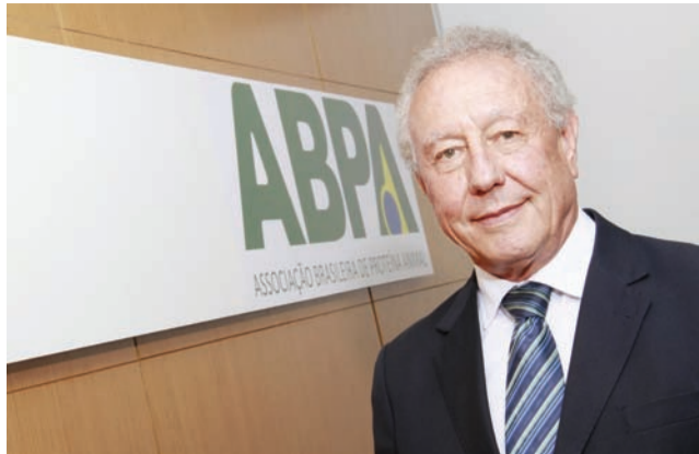
Francisco Turra-Presidente da Associação Brasileira de Proteína Animal (ABPA)