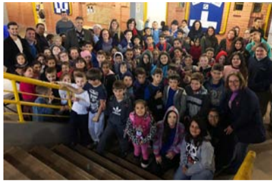
Escola E. Pedro Rosa/Tabai