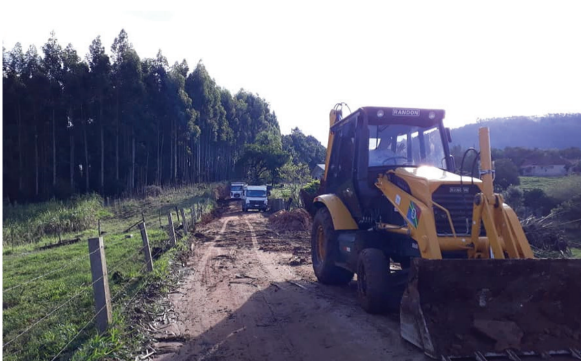
Estrada que dá acesso à pedreira em Tabai

A Secretaria de Obras realizou a limpeza na estrada da Pedreira onde ficou interditada, devido ao fogo colocado em taquaras e árvores no local - Página 05