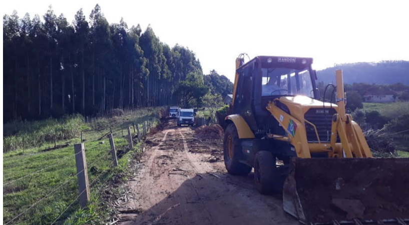
Prefeitura M. Tabaí-Foto Divulgação

A Secretaria de Obras realizou a limpeza na estrada da Pedreira, onde ficou interditada desde segunda-feira (22/06) devido ao fogo que devastou árvores e taquaras.