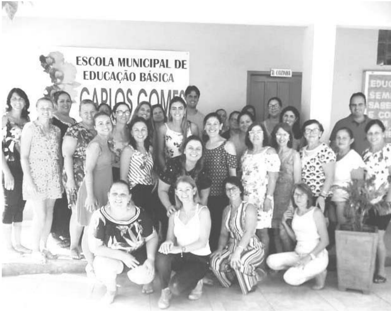
Docentes da Rede de ensino municipal de Tabai

A Secretaria de Educação de Tabai/RS firmou parceria com a Impare Educação, a fim de buscar apoio para a plena implementação da Base Nacional Comum Curricular.