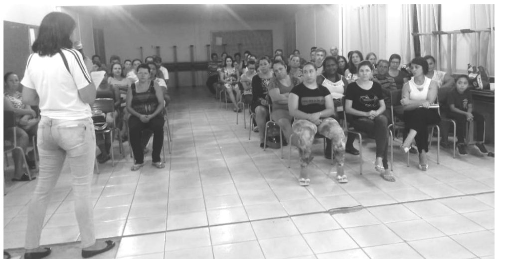
Durante todo o mês de março ocorreram reuniões nas Escolas Municipais com a participação dos Pais, Professores e Secretaria da Educação.

Durante todo o mês de março ocorreram reuniões nas Escolas Municipais com a participação dos Pais, Professores e Secretaria da Educação. Diante dos "tempos líquidos" que estamos vivendo e o aparente momento das "incertezas" se faz necessário uma par-