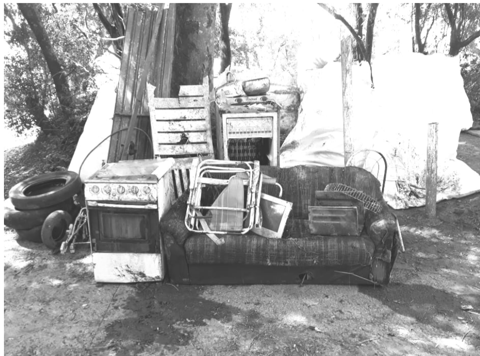
Em 23 de março aproximadamente 50 voluntários ajudaram a coletar quase uma tonelada de lixo nas margens do Rio Taquari

Seguindo uma tradição que aos poucos vai mudando a mentalidade de todas as pessoas envolvidas, em março a CERTAJA realizou atividades relacionadas ao DIA C - DIA DE COOPERAR 2019.