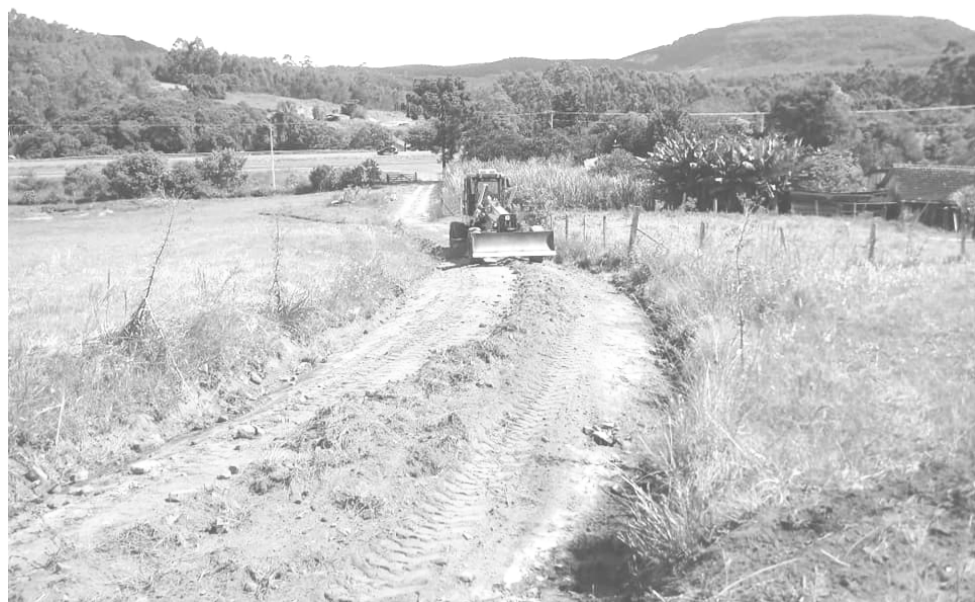
Estrada de acesso a Aldeia Indígena