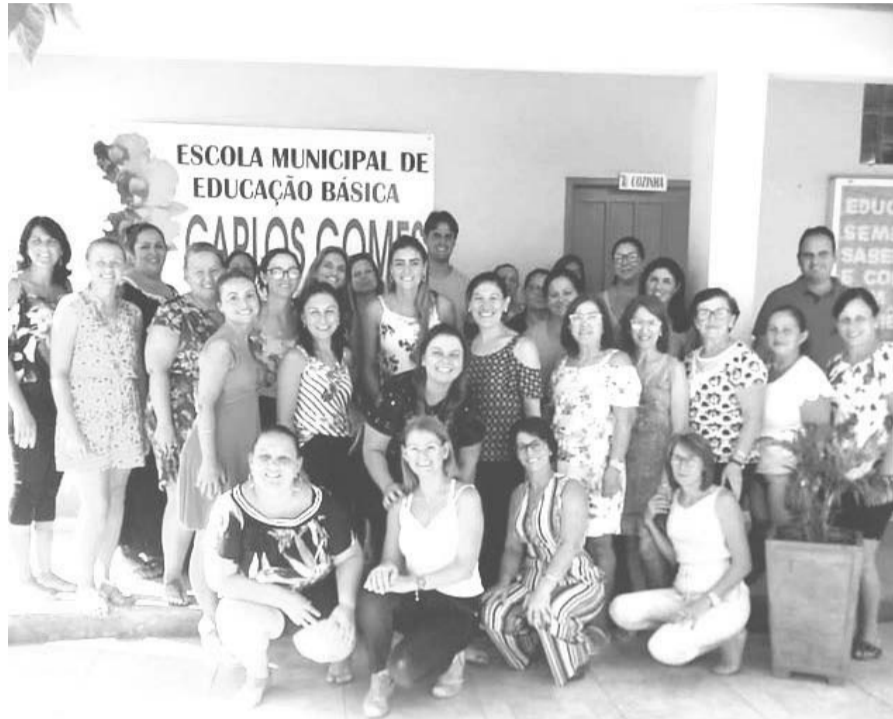
Docentes da Rede de ensino municipal de Tabaí

A Secretaria de Educação de Tabaí/RS firmou parceria com a Impare Educação, a fim de buscar apoio para a plena implementação da Base Nacional Comum Curricular.