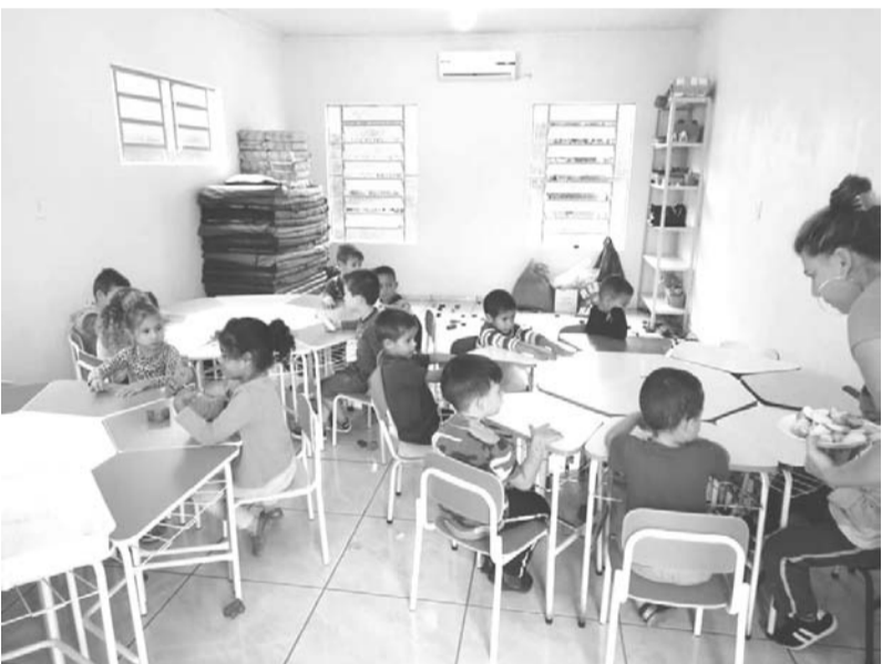
Alunos da EMEI Vó Chininha em Tabaí