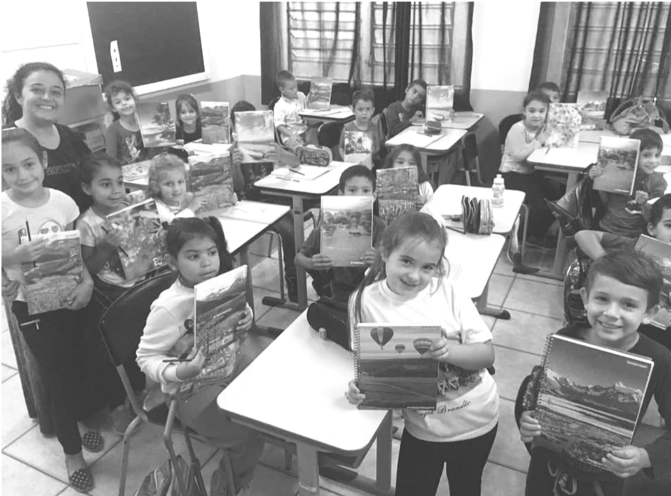
Alunos de rede escolar do município de Tabaí

No primeiro dia de aula, no dia 25 de fevereiro, os alunos foram recepcionados nas suas escolas com atividades de boas-vindas, organizadas com muito carinho e amor pela direção e professores. Página 05