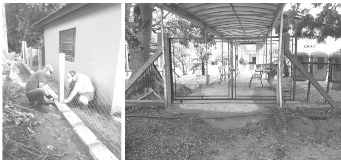
Escola Margarida Ribeiro em Tabaí-Foto: Divulgação

e instalação de um portão eletrônico que foi doado pelo "pai parceiro" Fabiano Quadros, ao qual agradecemos pela atitude.