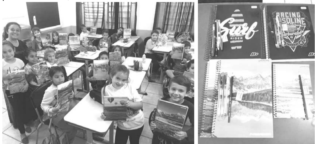
Alunos da rede escolar do município de Tabaí-Foto: Divulgação

teriais escolares e organizou "caixas" de materiais de uso coletivo, as quais serão mantidas na sala de aula dando condições para melhor realização das tarefas pedagógicas. Felizes pelo retorno, desejamos um ótimo ano letivo a todos!