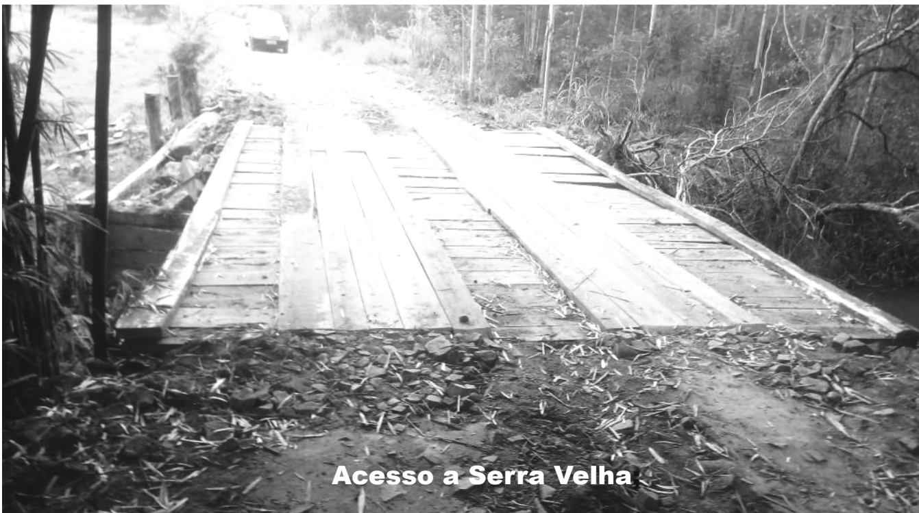
Acesso a Serra Velha

A Secretária de Obras tem feito vários trabalhos nas comunidades do interior, como consertos de pontes, patrolamentos, roçadas. Página 04