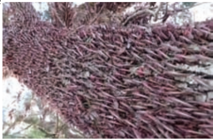
Por G1 RS

Portaria assinada pela ministra da Agricultura permite tomada de medidas emergenciais e uso de agrotóxicos para controle da praga, se necessário.