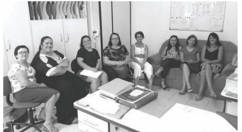
Coordenadoras e Diretoras da rede municipal de Tabaí

Na manhã de terça-feira (04), ocorreu a primeira reunião com as diretoras de Escolas para definição de detalhes, estratégias de trabalho e providências a serem executadas para o início do ano letivo, previsto para dia 17/02.