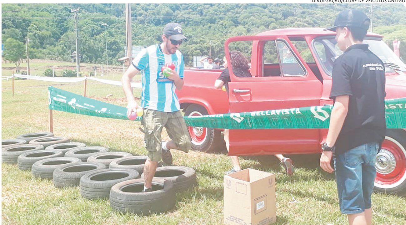
>> Evento contou com diversas atividades, como a realização de gincanas, movimentando os participantes