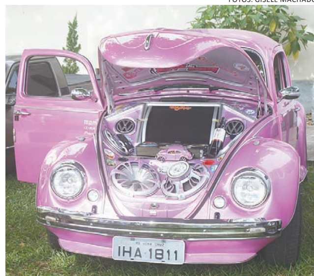
>> Veículos de diversas partes do Estado foram expostos

O Clube de Veículos Antigos do Centro Serra foi o promotor do evento.