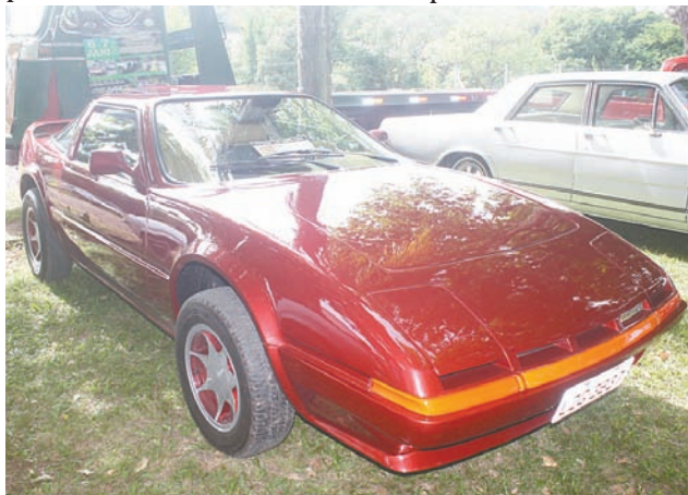
>> Evento aconteceu na Comunidade Martin Lutero