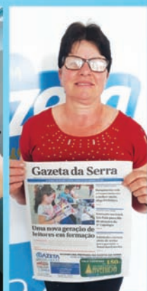
GLADES RUBERT ARROIO DO TIGRE

Assine ou renove sua assinatura e concorra todos os meses: