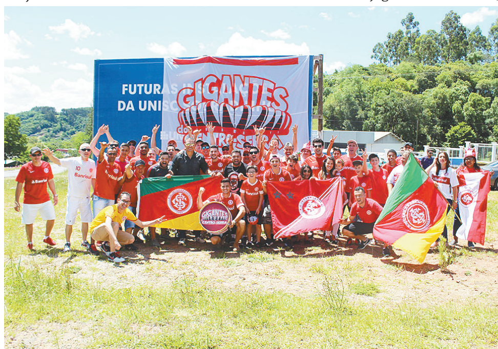
>> Antes do evento, colorados foram em peso ao trevo da ERS-400 recepcionar o ídolo

do com festa por dezenas de colorados no trevo de acesso a Sobradinho, na ERS-400. A recepção foi organizada pelos Gigantes do Centro-Serra, que presentearam o ex-goleiro com camisa e boné do grupo, além de uma tábua para churrasco personalizada. Os torcedores também saíram em carreta com o ídolo pelas ruas do município.