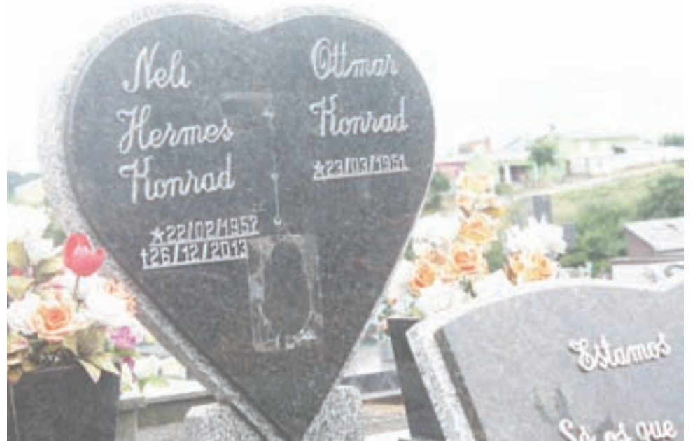
>> Ataques aos túmulos ocorreram na última semana e geraram indignação