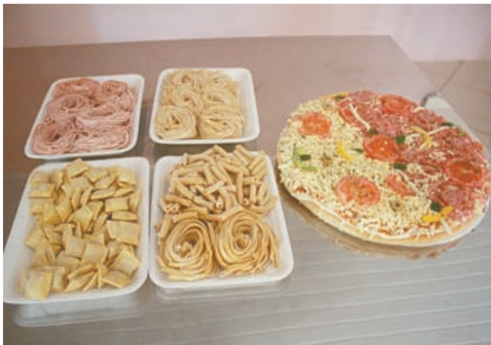
>> Massas e pizza: produtos que fazem sucesso entre os clientes

-Ascar na realização dos cursos e a ajuda prestada para a legalização da agroindústria. "Não há palavras que possam expressar a nossa gratidão. Eles foram e continuam sendo essências para o nosso negócio", destacou.