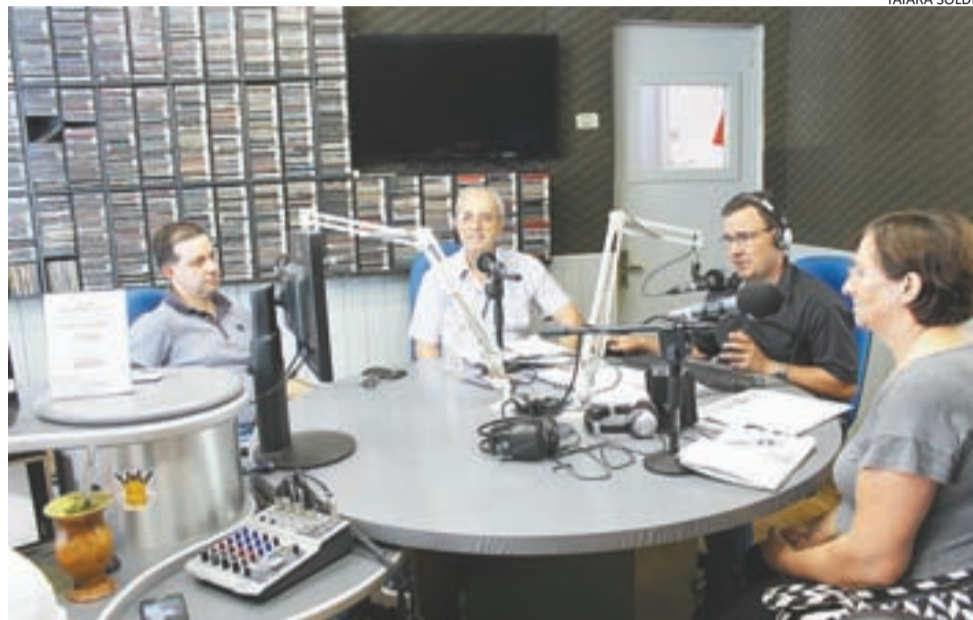
>> Equipe da Apae presente no Giro Regional da última terça-feira