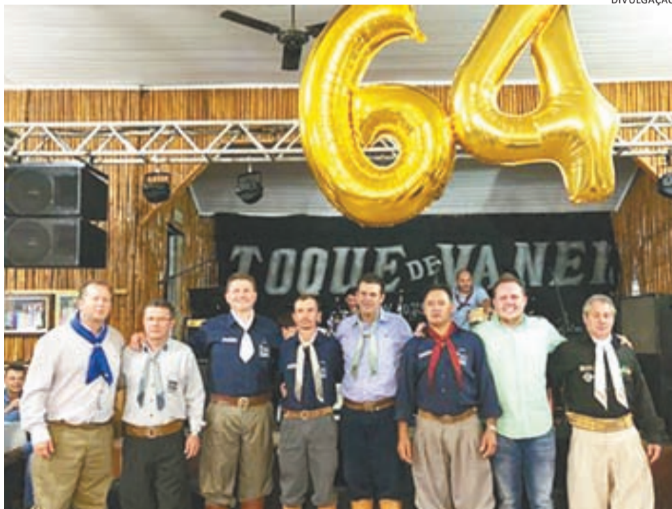
>> Aniversário do CTG Galpão da Estância foi celebrado na última sexta