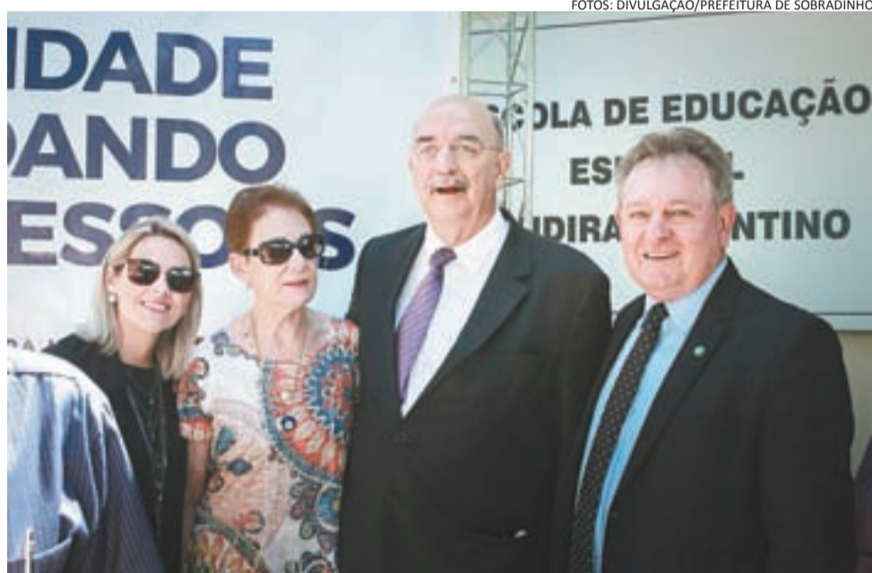
>> Secretária Saionara Soder e Beloni Turcatto com o ex-ministro Osmar Terra