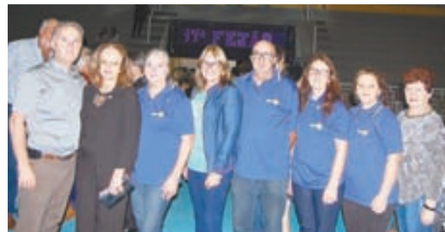
>> Rotary Club Sobradinho presente no evento