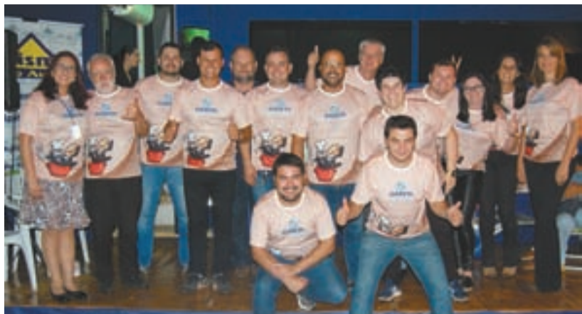
>> Turma da Gazeta na 17ª Fejão