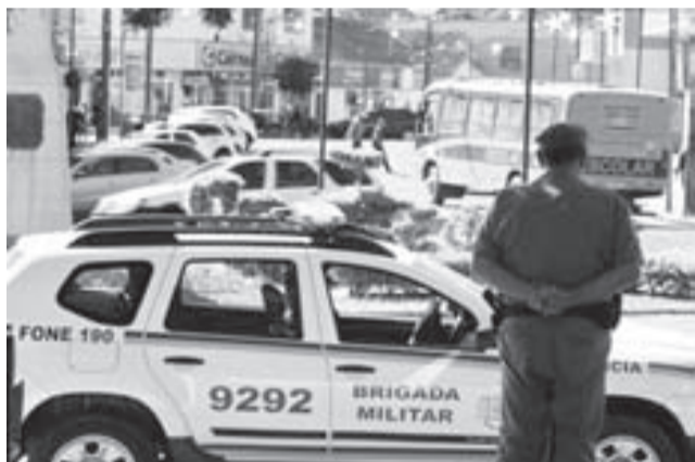
>> A Brigada Militar realizou 46 prisões neste ano