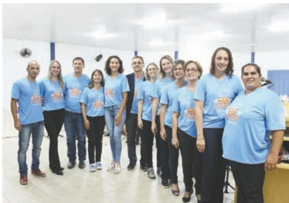
>> Coordenadores e professores das oficinas que serão executadas no projeto