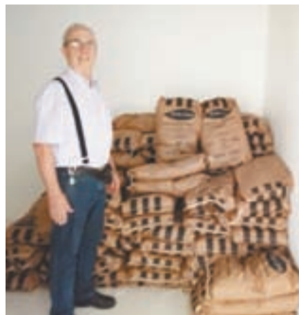
>> Diretor da Apae recebe alimentos

O ato contou com a presença do então ministro do Desenvolvimento Social, Osmar Terra - que nesta semana reassumiu o cargo de deputado federal. Em seu pronunciamento, Osmar Terra destacou que a doação beneficia as pessoas atendidas pela rede Apae e os agricultores familiares, que venderam parte da produção de leite, por um preço justo, para o Programa de Aquisição de Alimentos (PAA), coordenado pelo MDS.