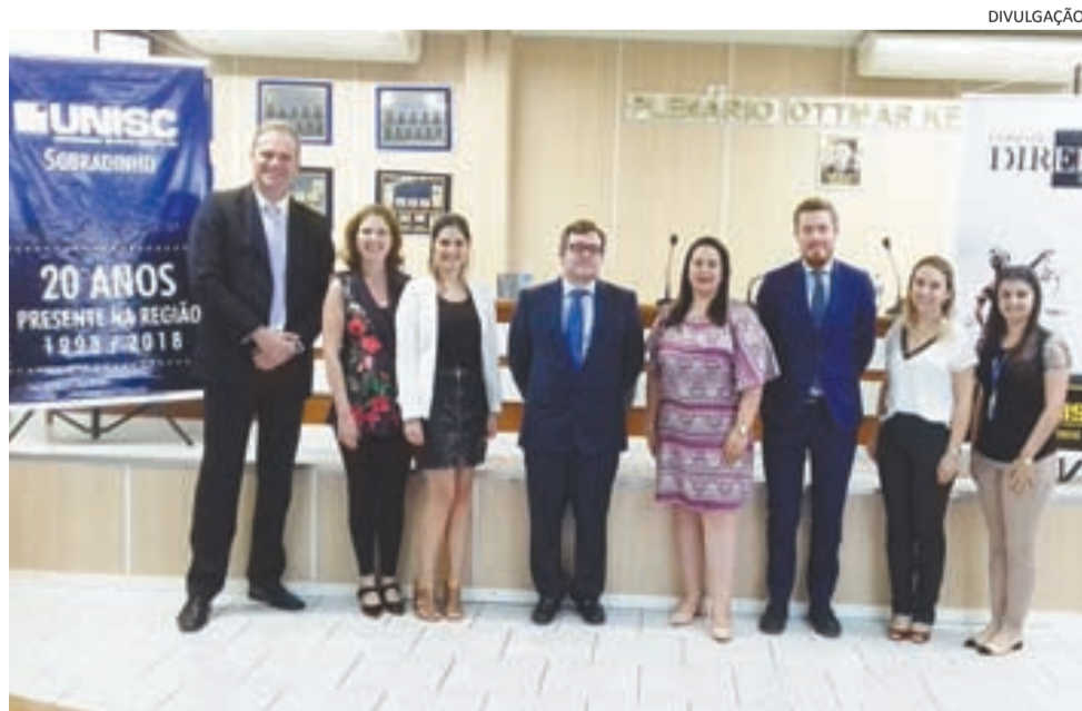
>> Evento promovido pelo curso de Direito ocorreu na Câmara de Vereadores