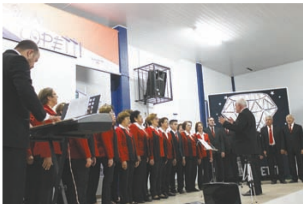
>> Coral Municipal de Sobradinho encantou o público durante o evento na sexta-feira